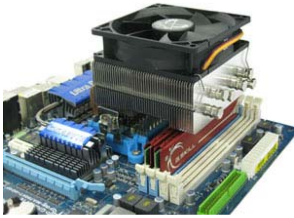
ソケット478・・・反対側